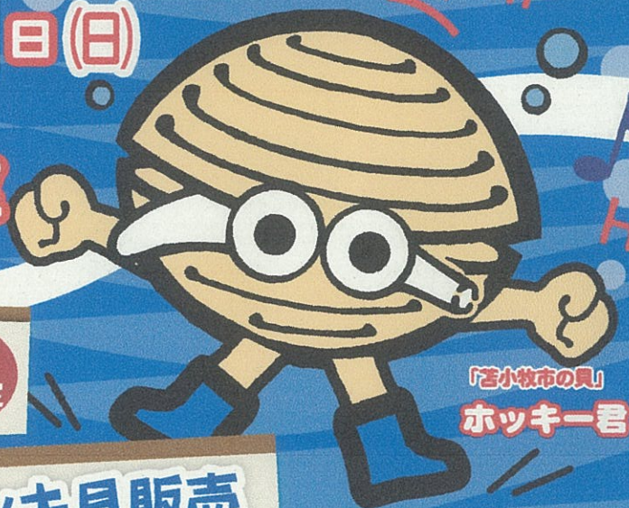
「苫小牧市の貝」 ホッキー君