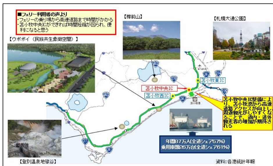
<苫小牧市周辺の主な観光地>