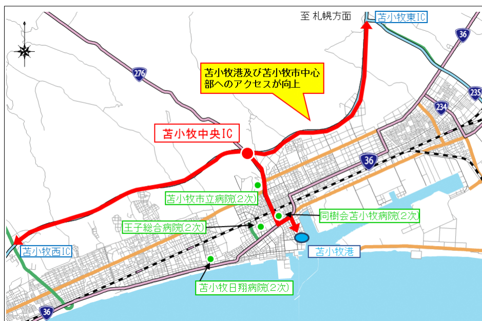
<苫小牧港及び苫小牧市内の高次医療機関>

高速道路から苫小牧市中心部へのアクセスが向上し、混雑する市街地を回避できることから、周辺自治体から高次医療機関への搬送の走行性向上が期待されます。